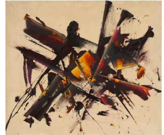
Judit Reigl, V (Outburst) , 1957, Stiftung van de Loo © VG Bild-Kunst, Bonn 2023