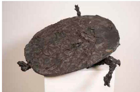
E. R. Nele, Held , 1960, Stiftung van de Loo © E. R. Nele

Neben einer größeren Schenkung an die Nationalgalerie Berlin 1990 markierte die Schenkung Otto van de Loos an die Kunsthalle Emden die zweite Schenkung dieser Größenordnung und führte zur ersten großen baulichen Erweiterung des Museums im Jahr 2000. Dieser mäzenatische Akt verdeutlicht nicht zuletzt den Stellenwert der Kunsthalle Emden als Museum der Avantgarde mit einer exquisiten Sammlung.